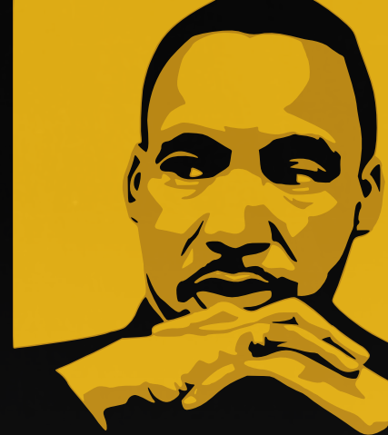
MARTIN LUTHER KING JR